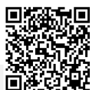
T800-EX 3D demo

(Optional) 1D/2D-Imager-Barcode-Leser oder serieller Anschluss oder Ethernet